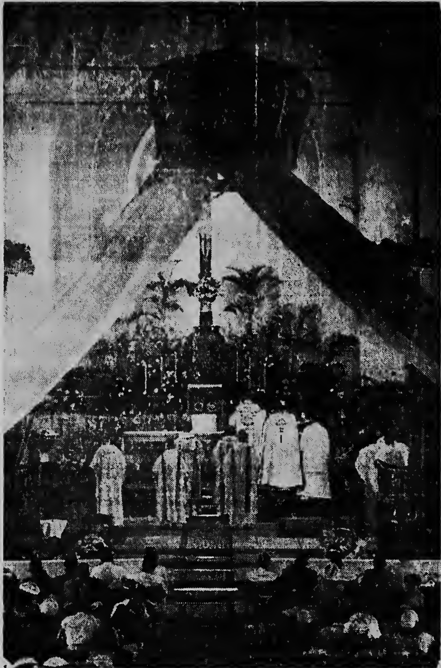
Un hista durante di Santo Sacrificio di Misa Pontifical cu a worde celebra den Misa St. Franciscus na Oranjestad ayera mainta y na tinda Obispo a predicar.